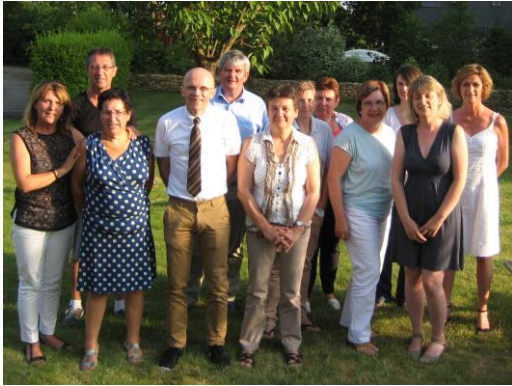
La Commission Animation de l'Association